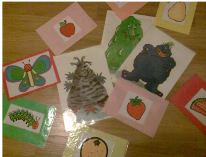
Ejemplo de flash cards

b) Juego de tarjetas : Es parecido pero no repasamos estructuras gramaticales, simplemente vocabulario. En vez de describir nada, simplemente voy levantando las tarjetas (flashcards). El niño que antes nombre el objeto en inglés se la queda. Este juego es muy dinámico y los niños se divierten mucho. Yo estoy en el centro levantando y repartiendo tarjetas a unos y otros. Luego les encanta contar, por supuesto en inglés, todas las que han conseguido.