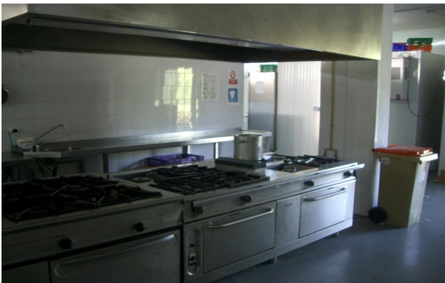
Imagen 3. Ubicación de los fogones en su parte trasera.