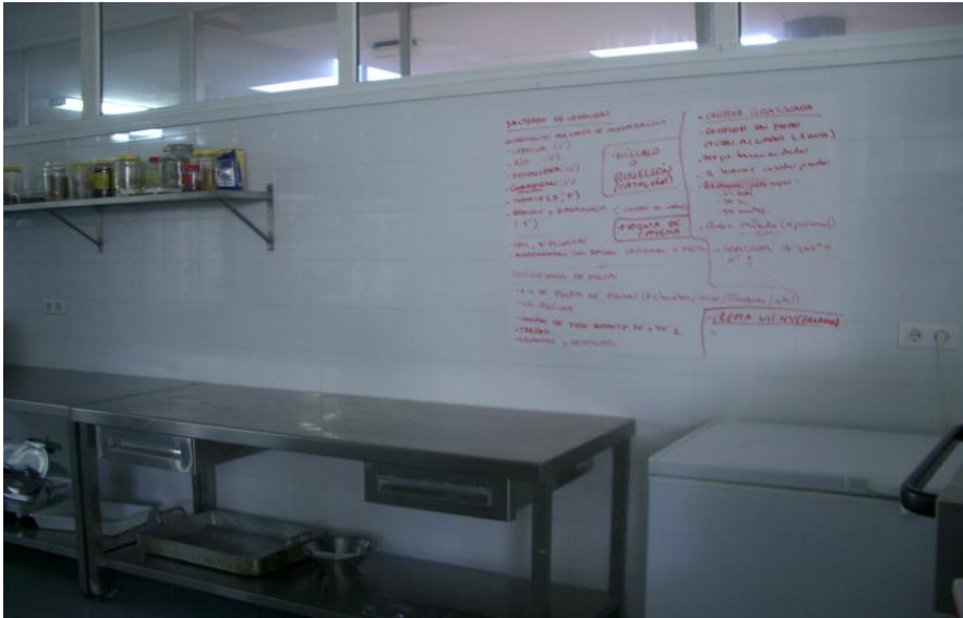
Imagen 2. Situación de la pizarra o adhesivo para escritura en el aula taller de cocina.

ISSN 1988-6047 DEP. LEGAL: GR 2922/2007 Nº 13 – DICIEMBRE DE 2008