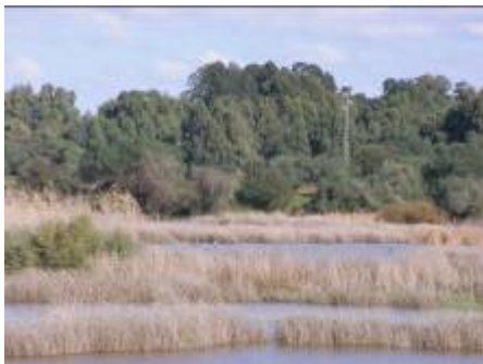
Parque natural Doñana (Huelva).

Sobre las 24:00, los alumnos/as se retiran a sus habitaciones, esa noche fue "muy larga".