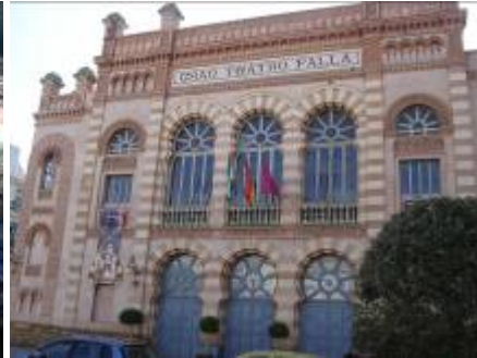
Gran teatro Falla (Cádiz).