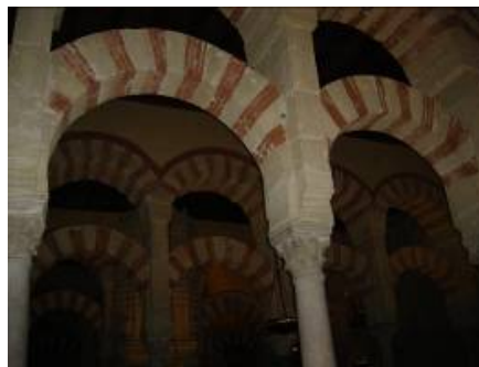
Mezquita de Córdoba.

Finalmente sobre las 23:30 de la noche todos los alumnos/as se dirigieron a sus habitaciones a “descansar”.