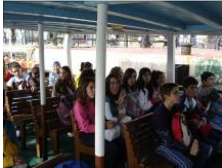
El "Vaporsito". Puerto de Santa María (Cádiz).