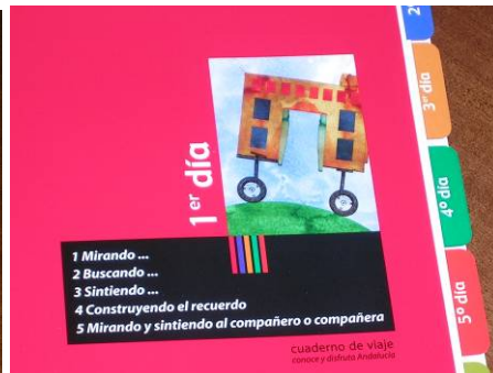
Interior del cuaderno de viaje.