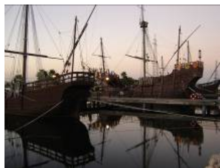
Muelle de las tres carabelas.