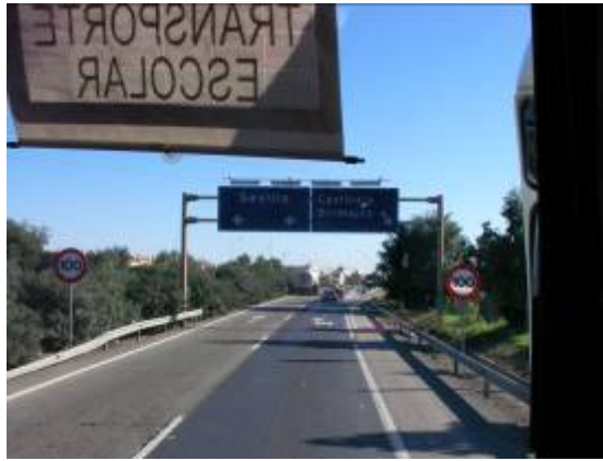
Camino de vuelta. Carreteras de Sevilla.

El desayuno fue un mal momento para la mayoría de los alumnos/as que presentaban caras de sueño, ya que habían dormido muy poco; eso vino bien para el camino de vuelta, ya que gran parte del viaje fueron durmiendo y de esta forma se les hizo menos pesado, ya que desde Huelva hasta nuestro pueblo, tardamos 8 horas, contando con la hora y media que paramos en Antequera para comer. Este fue el lugar donde los dos grupos nos separamos. A continuación, proseguimos nuestro camino de vuelta hasta el lugar de destino al que llegamos sobre las 17:00 horas aproximadamente.