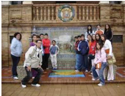
Plaza de España (Sevilla).

Nos dirigimos a la instalación juvenil donde se incluye el alojamiento y cena. Por la noche se reúnen los alumnos/as para completar su diario y comentar las experiencias vividas a lo largo del día. Sobre las 23:30 los alumnos/as se van a sus habitaciones.