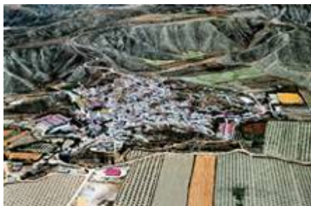
Vista aérea de Dehesas de Guadix.

Los pueblos están muy cerca de la frontera con la provincia de Jaén, en los denominados Montes Orientales, en concreto, Alicún de Ortega está situado en el límite de la provincia de Granada con Jaén a unos 100 Kilómetros de la capital.