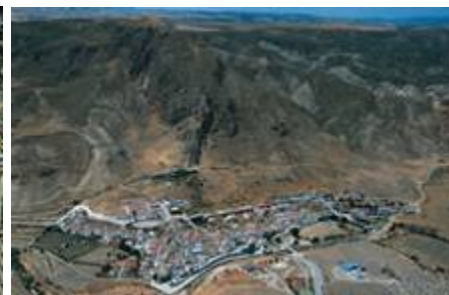
Vista aérea de Alicún de Ortega.

Las poblaciones de ambos pueblos son pequeñas, no llegando a los 800 habitantes. Al Centro asisten con regularidad 110 alumnos/as, cifra esta que se ve incrementada con algunos alumnos/as que vienen ciertas temporadas dado que sus padres son emigrantes temporales y regresan a la localidad cuando hay menos trabajo en la hostelería, sobre todo en Baleares o en los invernaderos de la Costa de Almería.