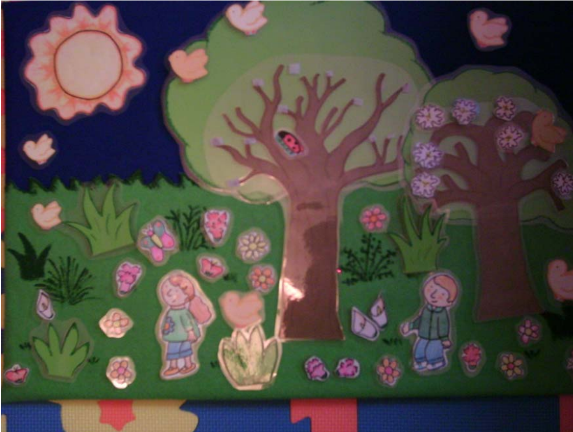
PAISAJE DEL VERANO.