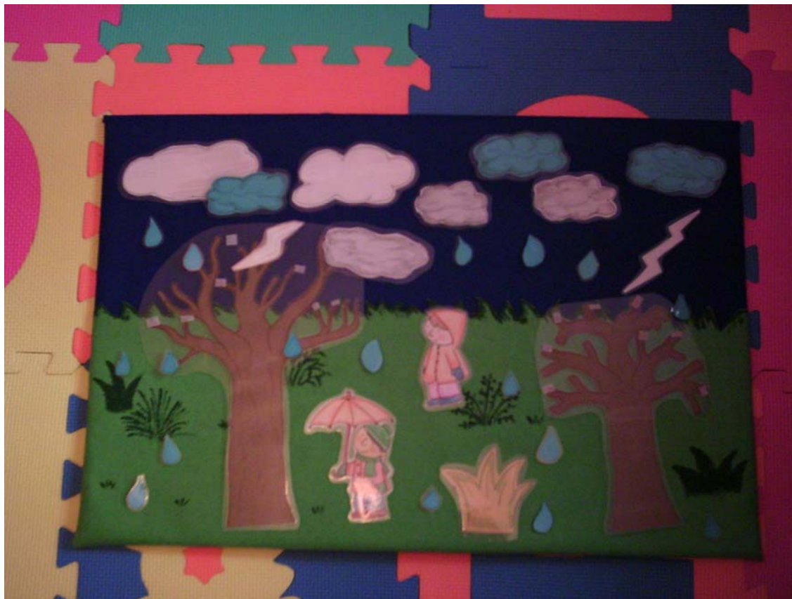
PAISAJE DE LA PRIMAVERA.