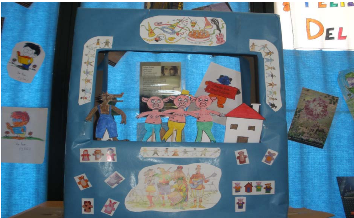
Dramatización de “Los tres cerditos”

Para dinamizar aún más la celebración del Día del Libro, se realizó una dramatización de “Los tres cerditos” que, por cierto, fue acogida con gran expectación por la totalidad de nuestros alumnos/as, tanto que hubo que repetir la función.