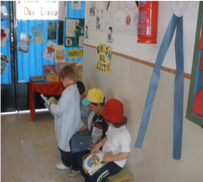
Rincón del lector

Las lecturas colectivas tuvieron su momento en el patio de la escuela ya casi al final de una espléndida mañana acompañada de un sol radiante en la que todos los participantes mostraron interés por tocar, ver, mirar, ojear o leer algún libro, sentados en alguna escalera o echados sobre la hierba, sólo o acompañados de otros, escuchando o pasando página. En definitiva, buscando la manera de divertirse con un libro entre las manos en un ambiente tranquilo y amigable. Se trataba de hacer eso, lecturas al aire libre.