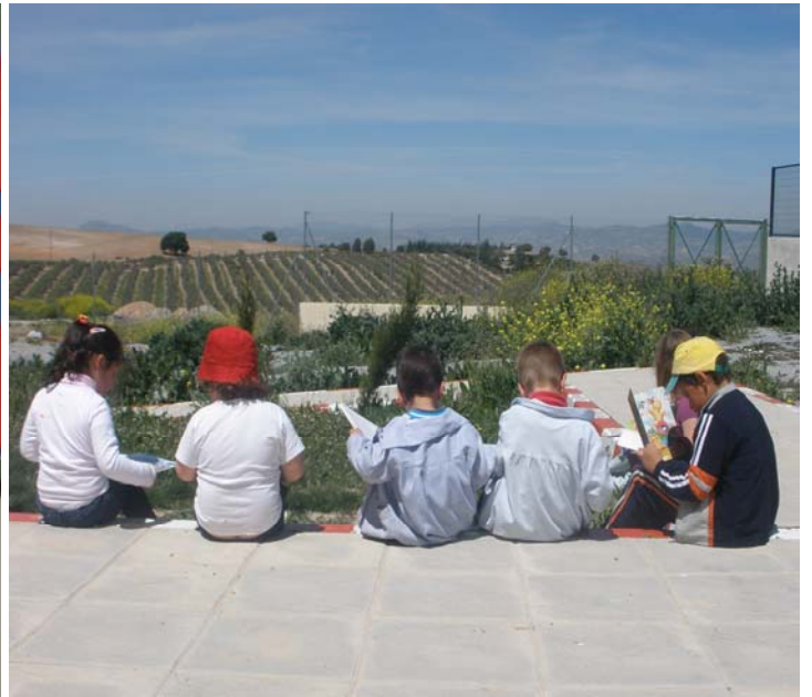
Lecturas al aire libre