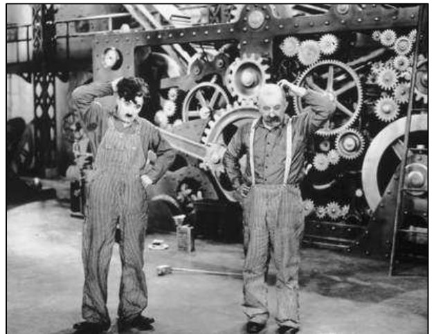
Tiempos Modernos , de Charles Chaplin (1935).

El taylorismo se caracteriza por suprimir en las cadenas de producción los tiempos muertos. De este modo, aparecen nuevos conceptos que se van introduciendo poco a poco: cronometraje, trabajo en cadena, y especialización del trabajador en un área específica. El taylorismo tuvo como consecuencia un enorme incremento de la producción, los empresarios aumentaron las ganancias y los consumidores accedieron al “Estado del Bienestar”.