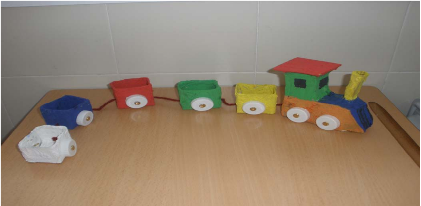
- Tren: Con tetra-briks pequeños forrados con papel y cola, pintados con témperas. Los vagones se unen con lana y las ruedas son tapones de los envases de leche.