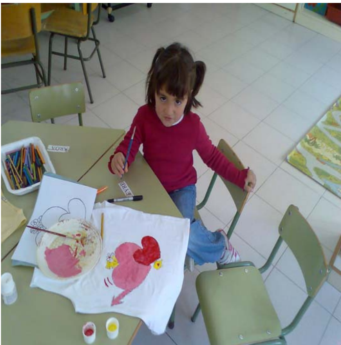
Camiseta de corazones