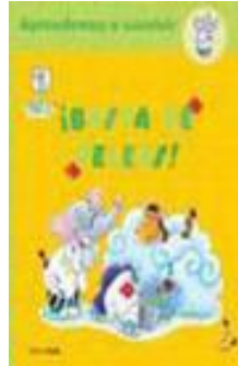
¡Basta de peleas! Marie Quentrec

Esta colección acerca a los más pequeños al mundo de la convivencia y las relaciones sociales. Cada historia muestra cómo un grupo de amigos, formado por una gran variedad de simpáticos animales, supera sus peleas y aprenden a convivir.