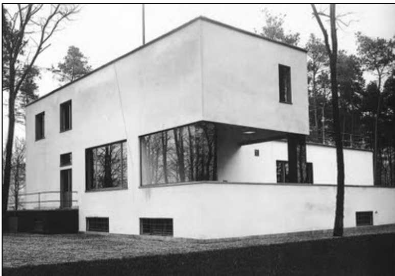
Casa del director de la Bauhaus, Gropius, 1925-26

Algo de la “jaula” ideal del gótico hay en la arquitectura del Movimiento Moderno: una malla de elementos portantes (metálicos o de hormigón) soporta los muros y los tejados, concebidos como membranas ópticas, espaciales y térmicas, más que como ingredientes estructurales de la construcción. Pero las formas, como se ven en la Casa del director de la Bauhaus , construida en Dessau por Walter Gropius en 1925-1926, tienden a ser ortogonales, y el equilibrado sistema de proporciones volumétricas está más próximo al espíritu del clasicismo que a la verticalidad de la arquitectura bajomedieval. Los lenguajes de la arquitectura moderna se han convertido en los únicos de la historia cuya difusión ha sido universal.