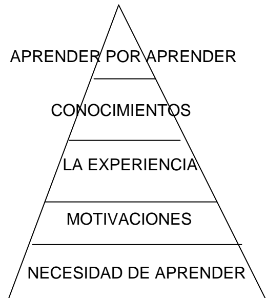
PIRÁMIDE NECESIDADES ALUMNADO

Según Cesar Coll (El País 20-2-2006 "Reflexiones sobre el actual debate educativo") "para sentir interés es necesario saber qué se pretende, y sentir que con ello se cubre una necesidad, puesto que si no se conoce el propósito de una tarea, no lo podrá relacionar con la comprensión de lo que la tarea implica y con sus propias necesidades y muy difícilmente podrá realizar un estudio en profundidad."