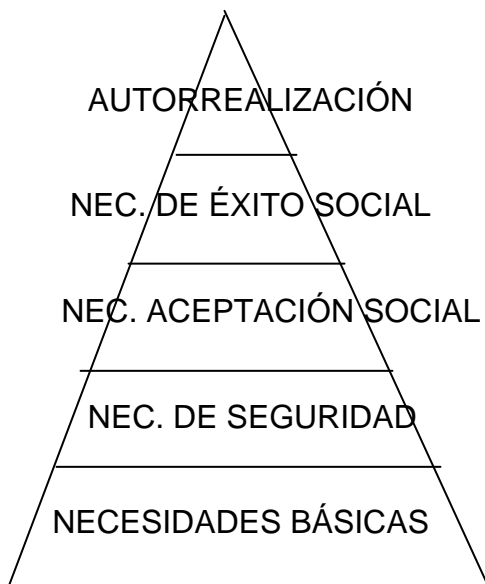
PIRÁMIDE NECESIDADES MASLOW

5.- Por último y quinto escalón, sería aprender por aprender (autorrealización) con lo que la evaluación del aprendizaje en el alumno/a nos mostraría su madurez para salir al sistema productivo pero se incluiría en su EDUCACIÓN unas capacidades de alto rendimiento y alta autoestima en el mismo.