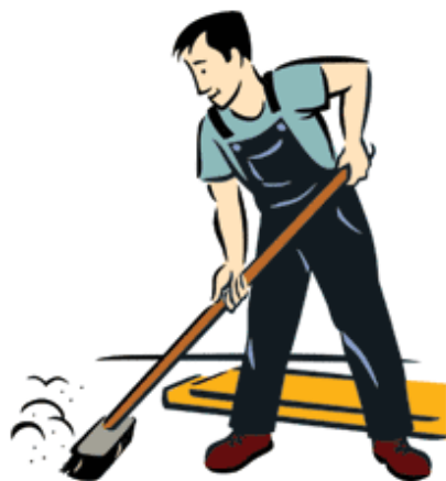
Figura 1. La limpieza del lugar de trabajo es fundamental

Dicen que no es limpio el que limpia, sino el que no ensucia. Un taller suele estar en mal estado físico debido a los malos hábitos de quienes en él trabajan.