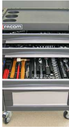
Figura 2. Correcto almacenaje de herramientas