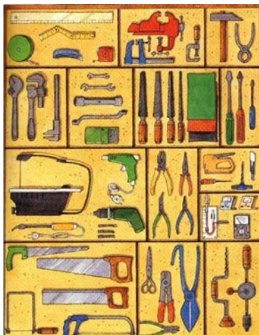
Figura 4. Panel ilustrativo de las herramientas de un aula-taller.

Para cortar, retirar o colocar flejes se utilizarán guantes apropiados y gafas de protección.