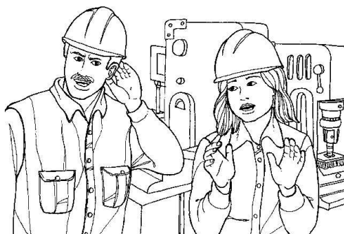
Figura 8. Riesgo de ruido en el taller.

El Real Decreto 286/2006 , de 10 de marzo, sobre la protección de la salud y la seguridad de los trabajadores contra los riesgos relacionados con la exposición al ruido establece que los riesgos derivados de la exposición al ruido deben eliminarse en su origen o reducirse al nivel más bajo posible.