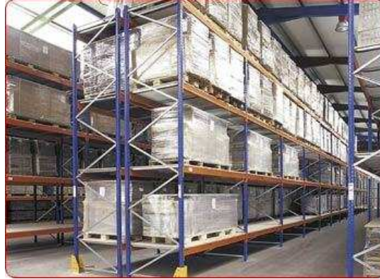
Figura 3. Apilamiento de materiales

Debemos destacar que “las pilas de materiales que puedan rodar (tubos, postes, troncos, etc.) deben asegurarse mediante cuñas, calzos o cualquier otro medio que impida su desplazamiento. No deben sobresalir aristas vivas hacia lugares de paso de igual forma “las barras ligeras pueden almacenarse verticalmente en bastidores especiales” al igual que “los bidones se deben apilar de pie y con el tapón hacia arriba. Entre fila y fila se pueden poner tablas de madera con la finalidad de soporte y protección.