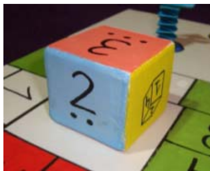
Dado de números y dígitos del Parchís Adaptado