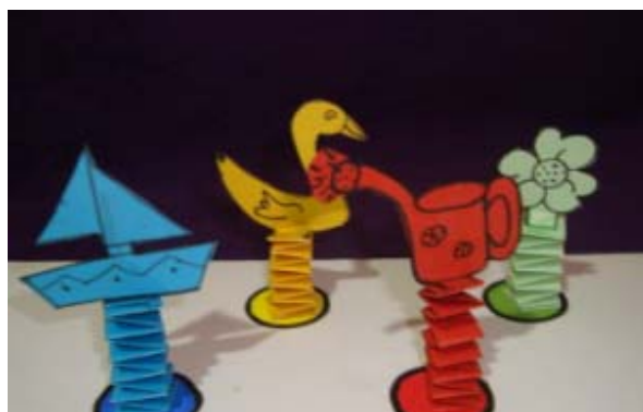
Fichas del Parchís Adaptado

Este juego del Parchís Adaptado es una acertada adaptación del parchís para niños/as que todavía no pueden jugar al clásico: menos casilleros, cuatro simpáticas fichas y dos grandes dados de madera, forman parte de las peculiaridades características de este juego. En realidad, se trata de adaptar variantes del juego original, como el grado de dificultad a las características del grupo-clase (más concretamente para alumnos de un Centro de Educación especial) y de incorporar fines didácticos encaminados a satisfacer las necesidades educativas especiales de estos alumnos.