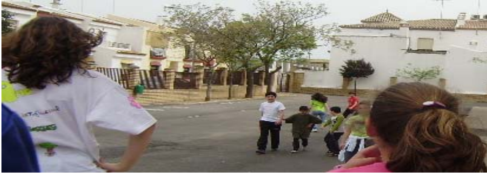
Alumnos de 4º Primaria trabajando con alumnos de 1º de ESO en el reconocimiento de la flora del patio del colegio (Desarrollan el proyecto "Protejamos a nuestro bosque").