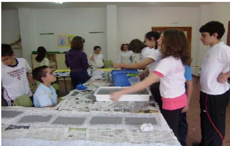
Taller de reciclado de papel desarrollado cooperativamente por alumnos de 1º de ESO y 6º de Primaria