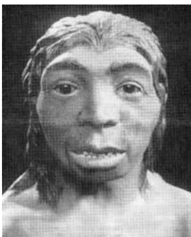
Posible imagen de un Neanderthal.

Somos seres sociales y vivimos en sociedad, eso conlleva unos derechos y obligaciones para con los demás, y una ayuda mutua. Esa sociedad funciona gracias a la solidaridad, tolerancia y responsabilidad de los individuos que la forman.